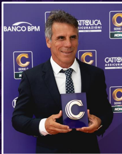
Gianfranco Zola Vice Presidente Lega Pro

228 gol e 770 presenze tra i professionisti, uno Scudetto, due FA Cup e una Coppa Uefa, presente nelle hall of fame del calcio italiano e inglese. Zola ha miscelato la sua esperienza di uomo di campo con le richieste dei club di C, realizzando una proposta che rimarca il fattore comune: la centralità e il rilievo dei vivai.